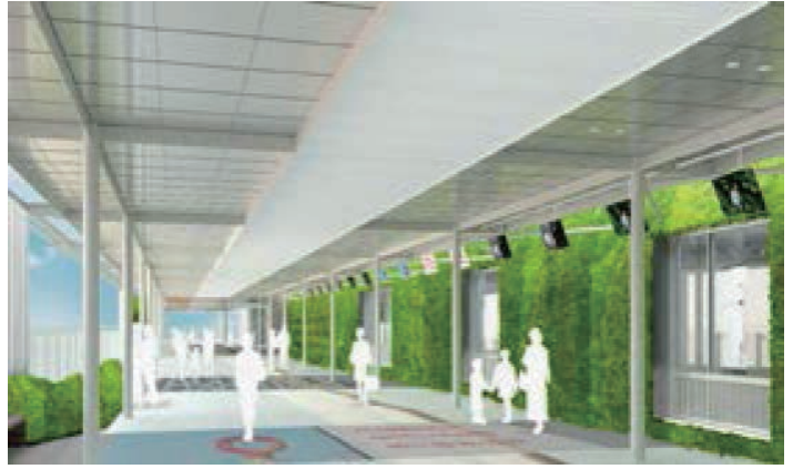
新山口駅南北自由通路

小郡上郷・下郷地区の污水管及び小郡下郷地区の雨水と污水をひとつの管路で排水する合流管の整備と長谷ポンプ場の改築・更新を計画的に進めます。