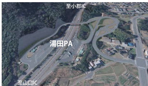
湯田 PA スマート IC

市内初の市街地再開発事業となる黄金町地区第一種市街地再開発事業について、都市再開発法に基づく支援を実施します。